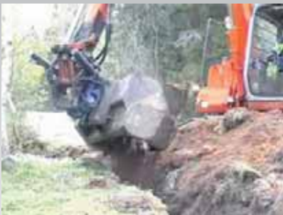
L 85 på rototilt, (L 75 passer også til rototilt)

Hvis du vil have markedets mest effektive skovl, skal du satse på en WL-skovl. Dobbelte motorer bevirker, at tingene går næsten dobbelt så hurtigt. WL på en gravemaskine er markedets Rolls Royce.