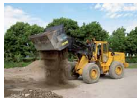
WL 170 sorterer genbrugsgrus.