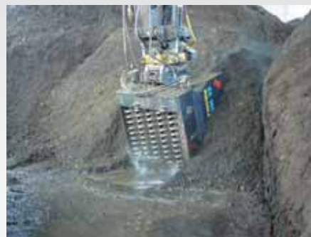
EX 180 HD MIX Sorterer tørv og rensningslam

At rense f.eks. stubbe for jord og grus meget effektivt.