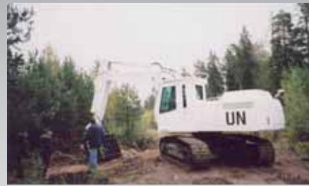
REMU på FN-arbejde.

REMU har forskellige typer af klinger tilpasset til specielle formål.