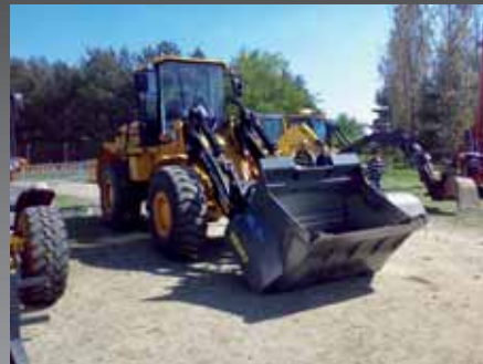
WL 160 Combi på en Hyundai.

WL-modellerne anvendes til store maskiner med godt hydraulikflow.