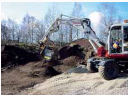
L 75 monteret på Rototilt.

Ved at anvende forskellige typer af klinger får man en skovl til ethvert behov. Det åbne design giver mulighed for et rensekammer, som holder rent mellem klingerne, når man sigter vanskelige materialer.